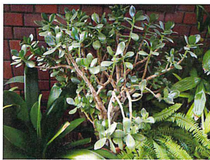
前列の枝にしだれが出てきました。風情を感じます。楽しみです。