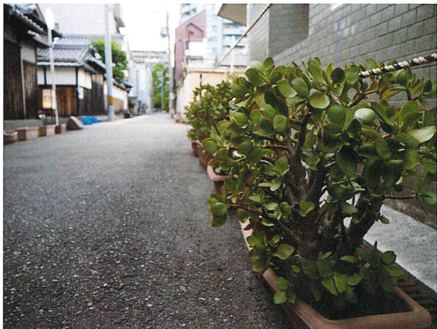
昭和町から松虫へ向かう道の、通称「成金草の並木道」。長屋の風情も素敵です。