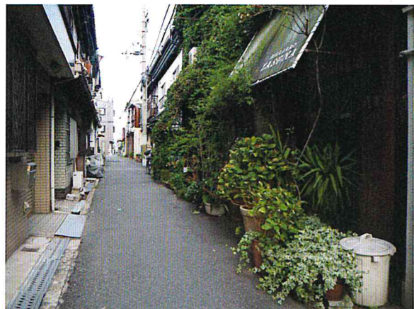
松虫通りから一步入るとそこは別世界。懐かしい空間とボタニカルアートが町の歴史や文化を感じさせてくれます。

大通りから一步路地に入ると大切に育てられた植物が並びます。旧き良き時代の大阪の文化が感じられ、眺めながら歩いてみるのも楽しいですね。今年の夏は暑さ対策で日よけをかけたたり、優しい心遣いも。