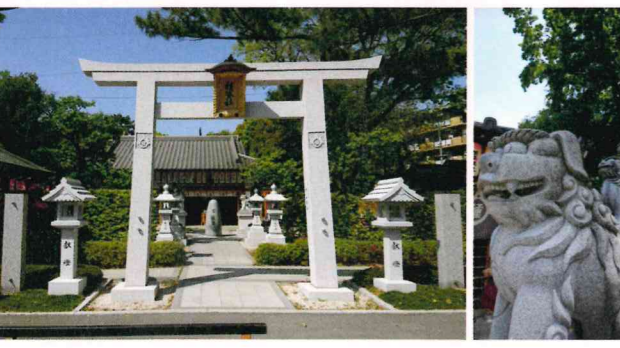
参拝ポイントを参考にお椀の船に乗って船出を誓いましょう。

「みすや針」 ★(これまでの話し)安立の街には江戸時代の「三栖屋」を始めとして、針を製造販売する多くのお店があり、当地の名産品となっていました。また、針の行商人も多く住んでおり日本各地に販売していました(安立商店街資料より) 住吉大社から大和川まで参勤交代の行列がつかない江戸時代の絵図を探せ! 本当にお土産として重宝されていた「針」を、店頭で売る一人一人の笑顔も描かれているのか! というミッションが記者に課せられたのでした。