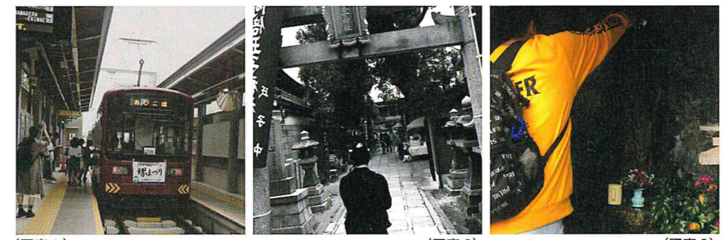
(写真1) (写真2) (写真3)

ちん電天王寺駅前→松虫。(写真1) 阿部王子神社みのり市に潜入。フードやグッズに興味なく八咫烏輪投げでレアなシールをゲット、「木霊の神様」に感動する。(写真2) ドーナツ屋あたりきしゃりき堂で揚げたてを待つ間に、けん玉にはまる。松虫へ徒歩で戻り、はやし製菓本舗で浪花ことばせんべいをゲット(動画撮影)！